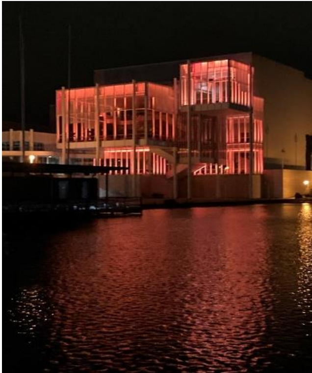
Espeen kulttuurikeskus