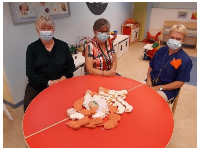
Poukkusillan Martat ja sukkaa