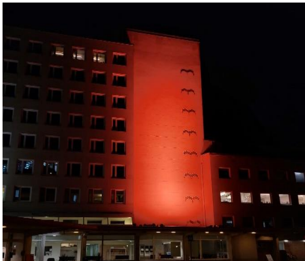
Vaasan keskussairaalan oranssi valaistus, vauvoja ja henkilökuntaa

Vaasan keskussairaalassa 17.9. syntyneille vauvoille lahjoitettiin oranssit pipot, sairaalan päärakennus valaistiin oranssilla ja lisäksi osallistuttiin päivän webinaariin. Keskussairaala näkyi aktiivisesti myös sosiaalisessa mediassa päivän aikana. Potilas- ja asiakasturvallisuuden kehittämiskeskus toimitti kakkutervehdykset Vaasan keskussairaalan äitiyspoliklinikalle, synnytysosastolle, synnyttäneiden vuodeosastolle ja keskolan henkilökunnalle sekä tuoreille vanhemmille.