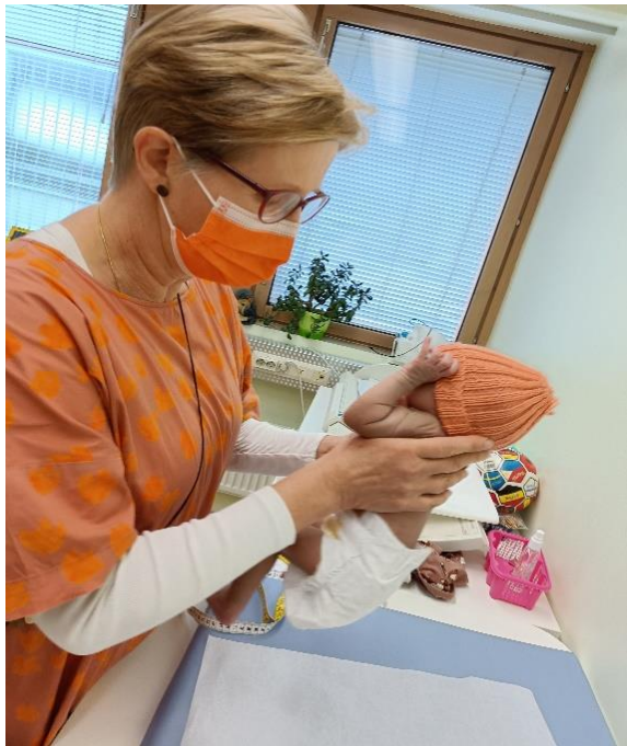
Espeen neuvolassa pukeuduttiin oranssiin